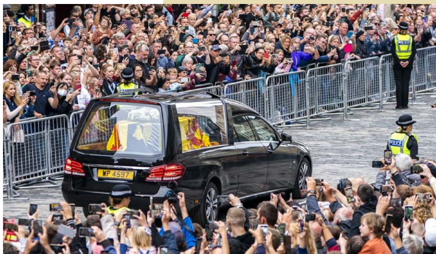
Caixão com corpo de Elizabeth II chega ao Palácio de Buckingham

• Elizabeth II morreu aos 96 anos em 8 de setembro um castelo na Escócia. Seu filho herdou o trono e se tornou rei Charles III.