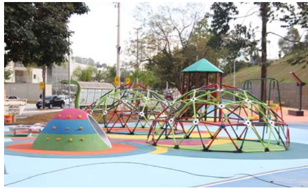
Nova praça tem mais de 3,7 mil metros

A Prefeitura de Barueri vai entregar em breve à população uma nova praça no Jardim Tupanci com diversos equipamentos de lazer. São mais de 3,7 mil metros quadrados em um espaço que tem pista de caminhada, área para patinação, playground com mais de 10 brinquedos, bicicletário, totem com energia solar para carregamento de celulares e tablets, mesa para jogos, entre outros.