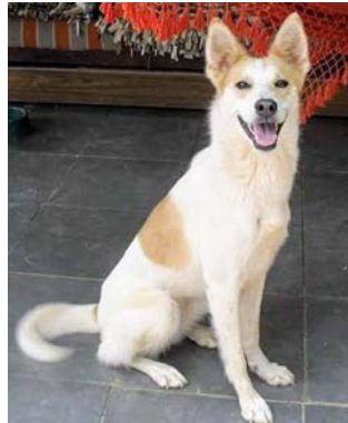
Gisele Bündchen, já virou estrelinha