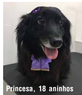
Princesa, 18 aninhos