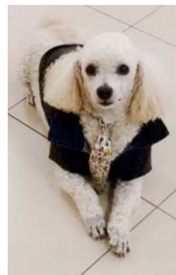
Robô, virou estrelinha

lado até a morte – alguém que te abandona de repente?