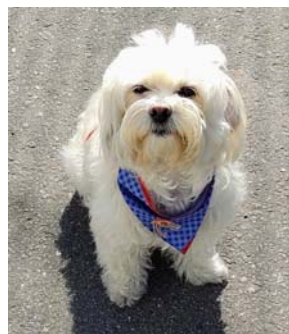
Botico, 8 aninhos