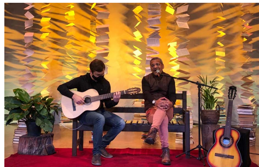
No segundo domingo de agosto é comemorado o Dia dos Pais. A data é uma forma de fortalecer ainda mais os laços familiares.