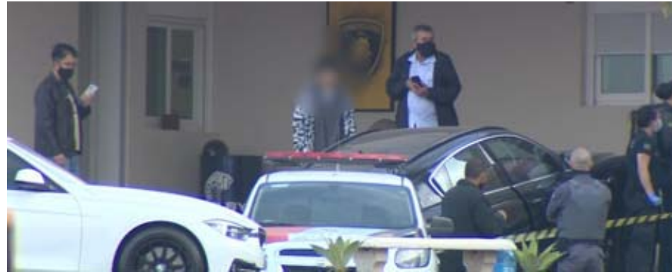
Homem era empresário e teria agredido mãe de jovem momentos antes do crime, de acordo com informações da PM