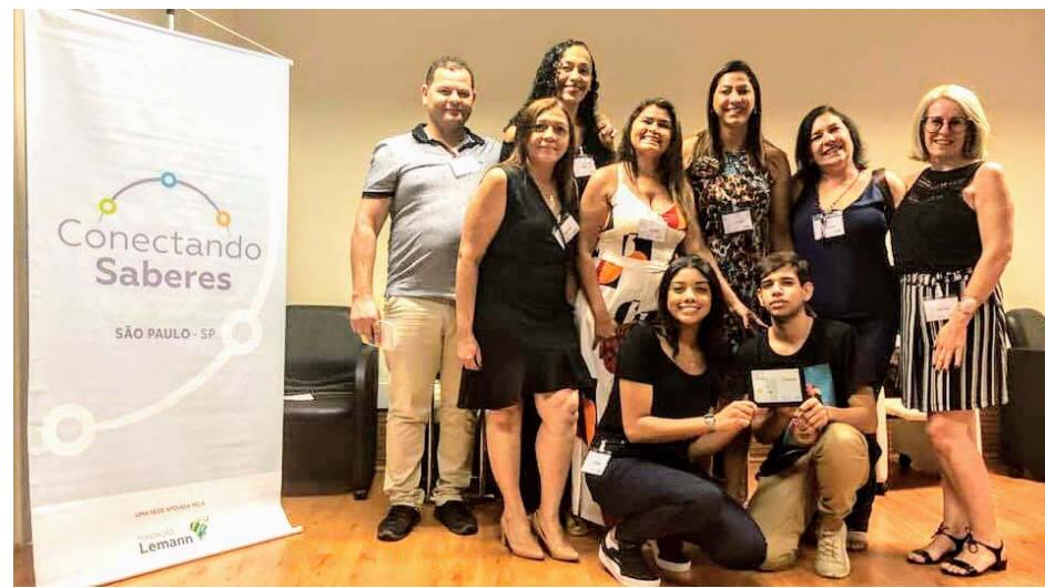
Representantes Projeto Conectando Saberes, Fundação Lemann e Professoras homenageadas