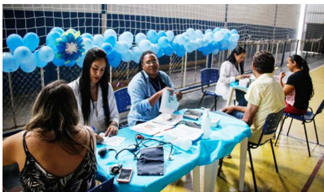
Agentes da saúde realizam atendimento aos munícipes no "Dia D" no Ginásio Poliesportivo do Bairro 120

O evento contou com diversas palestras de conscientização sobre "O entendimento da doença e a importância das ações para o controle e a sobre a prevenção de Câncer de Próstata", "A importância da prática de exercícios para o controle de diabetes e pressão alta", "Orientação no uso dos medicamentos e insulina", "Orientação odontológica no tratamento das doenças crônicas", "Conviver com a doença em busca da melhor qualidade de vida", "A importância da dieta no tratamento das doenças crônicas", e uma apresentação teatral voltada a importância